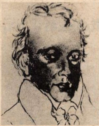
Kempelen Farkas önarcképe

A magas hivatali beosztások anyagi függetlenségét eredményezték számára, s miközben példásan állt helyt az iratok és akták tengerében, érdeklődése a gépek és egyéb műszaki szerkezetek felé fordult. Pozsonyban, Duna utcai házának második emeletén rendezte be híres műhelyét és laboratóriumát, melyben számtalan találmánya született meg. A szó szoros értelmében ezermester volt, szabad idejében fűrt-faragott, bonyolult mechanikai szerkezeteket összeállítással törte a fejét. Emellett írt és beszélt hét nyelven, művészi szinten zenélt és rajzolt, foglalkozott rézmetszéssel, írt verseket, vigjátékokat és zeneműveket. Gyakran rendezett Bécsben udvari műkedvelő előadásokat, melyeken sokszor az ő színdarabjai is előadásra kerültek.